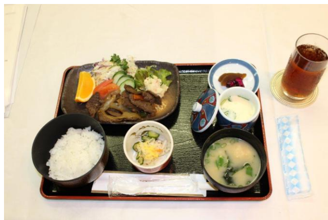
本日の食事 焼き肉定食