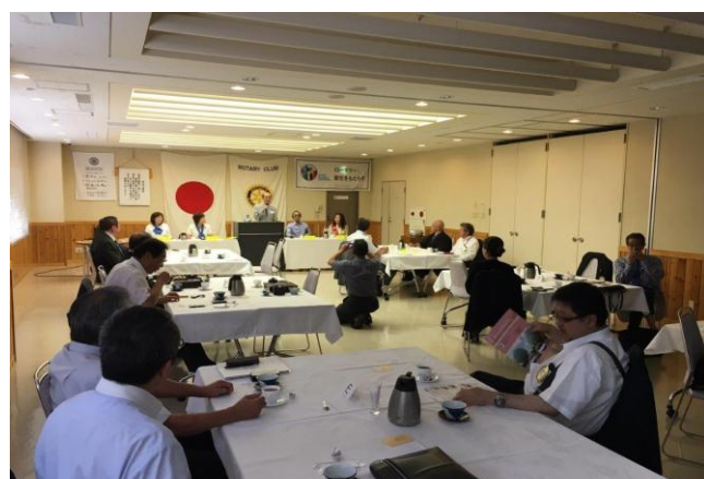
7/27 総社RC ガバナー補佐公式訪問