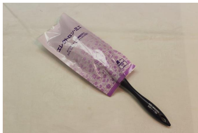
暮らしの中のフラットヤーン (お土産)