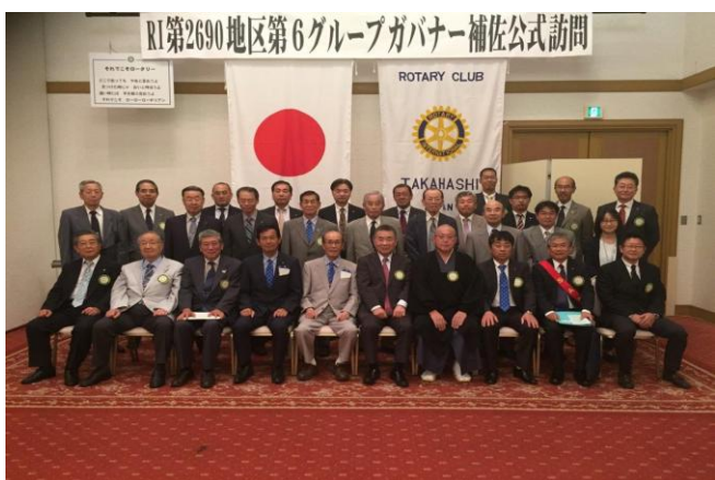
7/26 高梁RC ガバナー補佐公式訪問