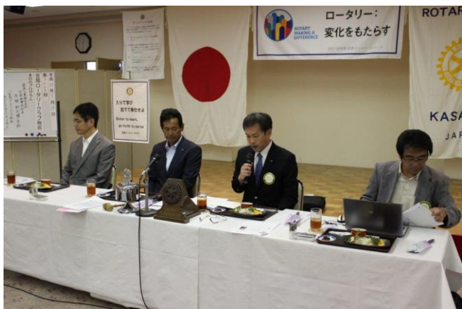
吉本副会長 会長代理で例会スタート