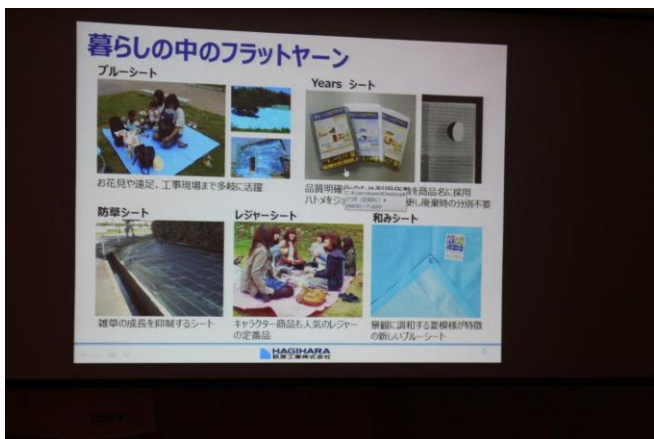
暮らしの中に使われている例