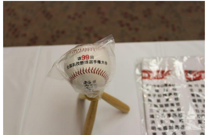
おかやま山陽高等学校 甲子園初出場の記念品