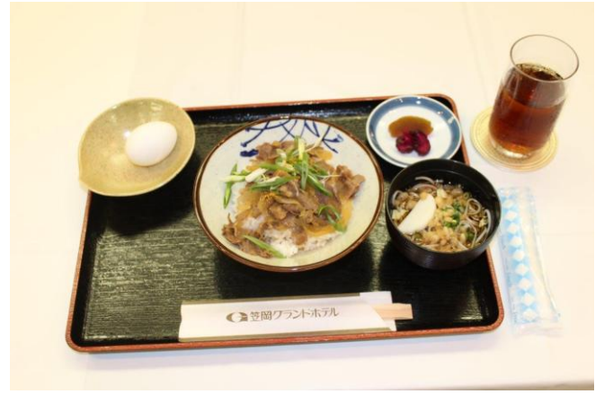
本日の食事 100万ドルランチ (牛丼)