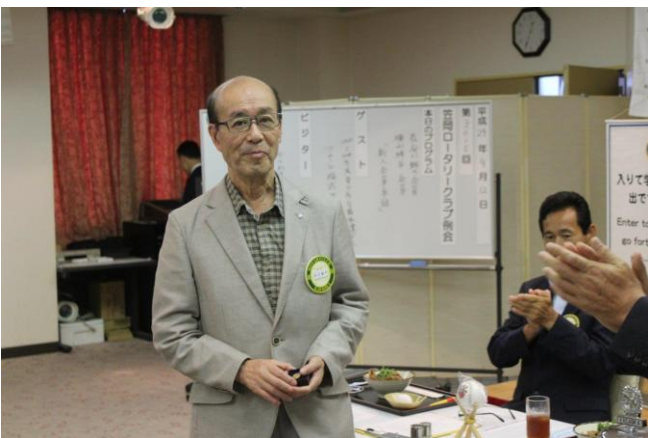
国会会員 5回目のポールハリスフェロー