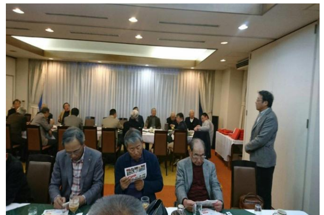
11/19 4クラブゴルフ大会