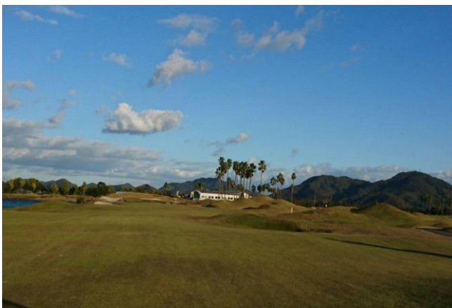
11/19 4クラブゴルフ大会