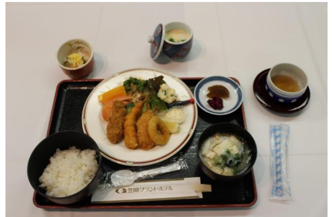
本日の食事 ミックスフライ定食