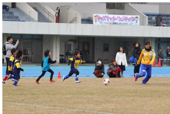
11/26 キッズサッカーフェスティバル