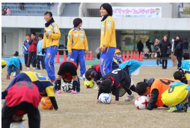
11/26 キッズサッカーフェスティバル