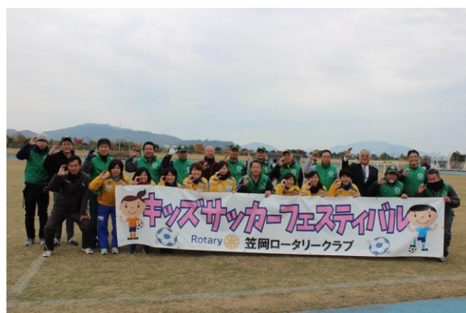
11/26 キッズサッカーフェスティバル