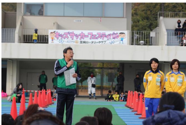
11/26 キッズサッカーフェスティバル