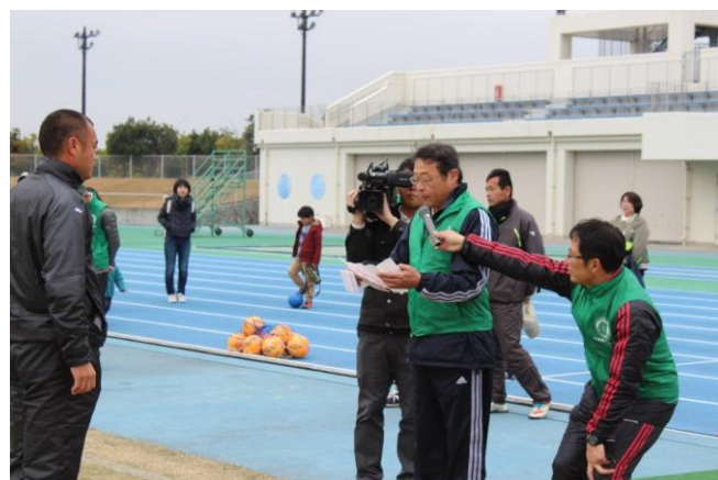
11/26 キッズサッカーフェスティバル