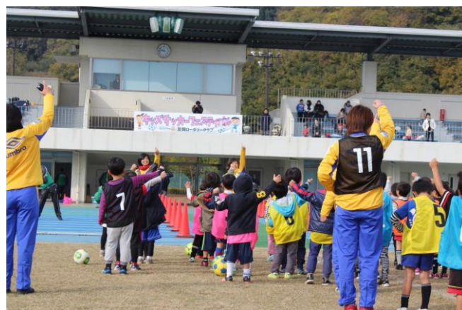
11/26 キッズサッカーフェスティバル