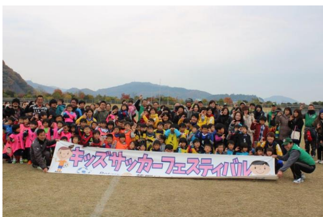
11/26 キッズサッカーフェスティバル