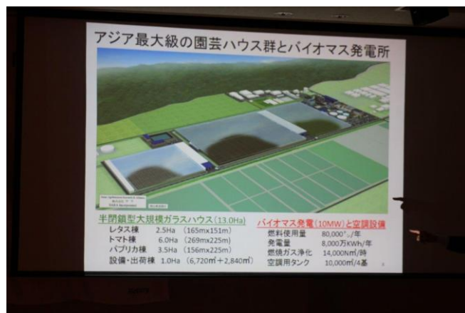
卓話「農業ベンチャー笠岡干拓地に大規模ハウス」