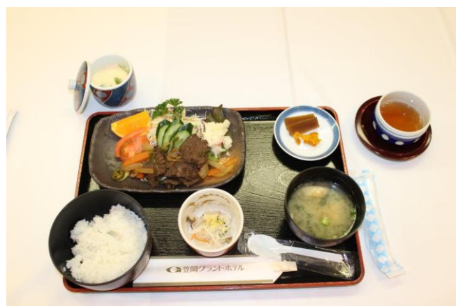
本日の食事 焼き肉定食