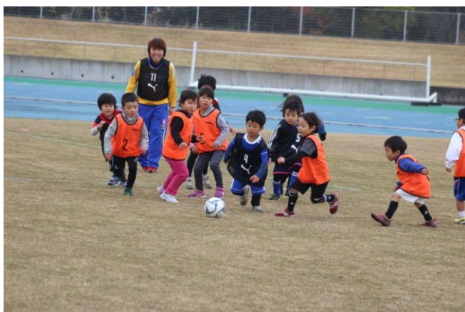
11/26 キッズサッカーフェスティバル