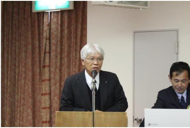
枝木財団・奨学会常任委員長