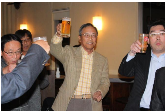
11/28 I DM