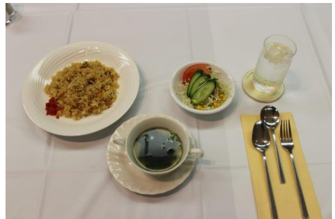
本日の食事 100万ドルランチ(ピラフ)