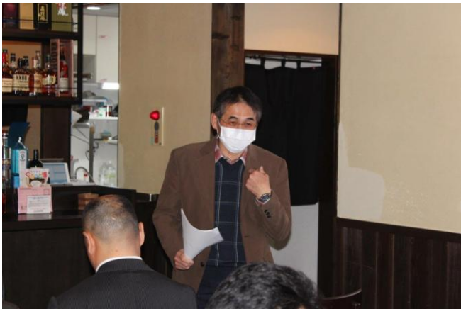
11/28 I DM