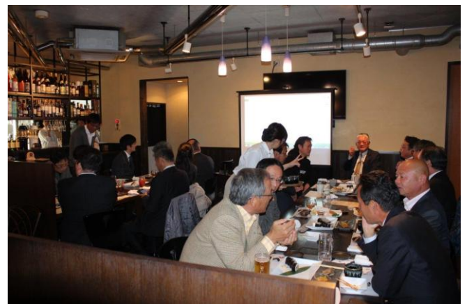
11/28 I DM