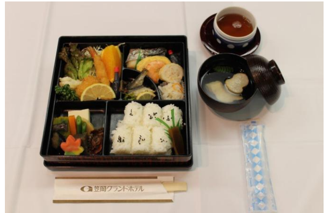
本日の食事 幕の内弁当