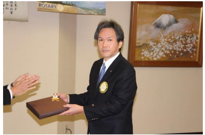
結婚記念月のお祝