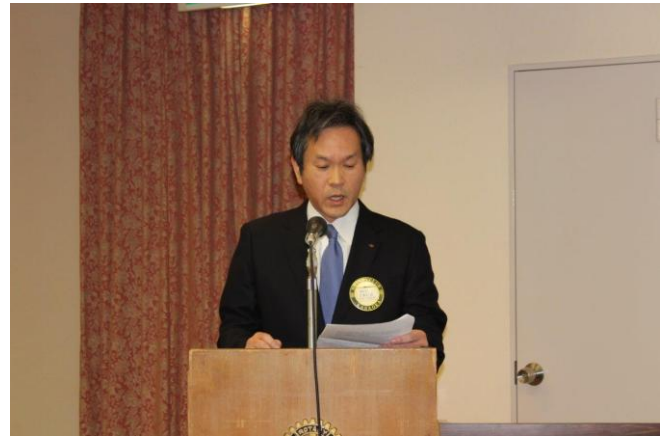
年次総会 吉本会長エレクト説明