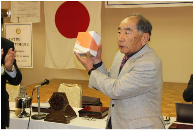
笠岡市文化の日記念表彰御受章のお祝