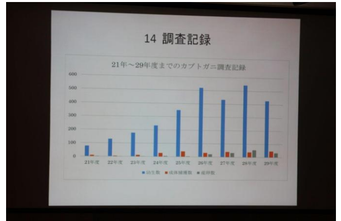
卓話「カプトガニの状況」