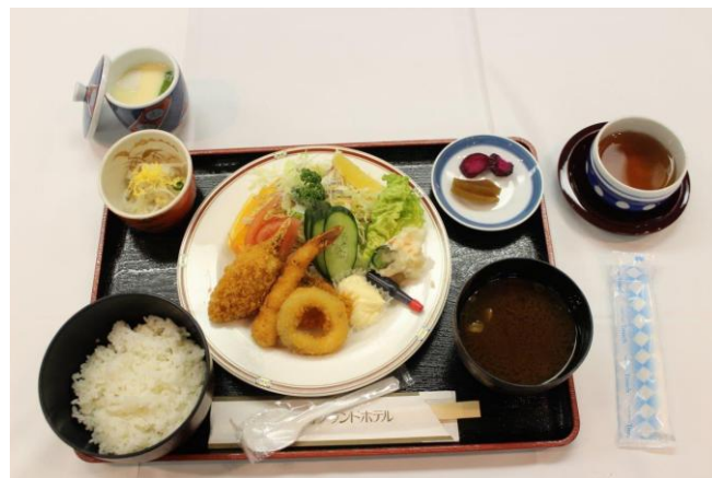
本日の食事 ミックスフライ定食