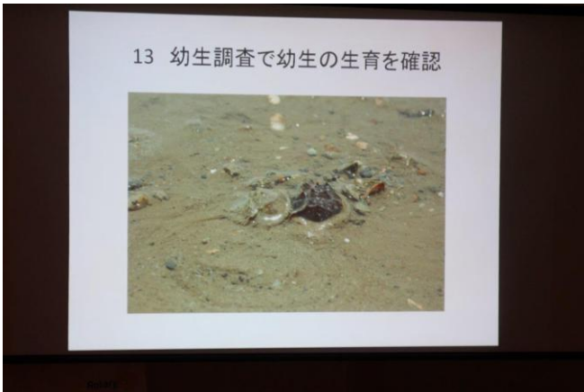
卓話「カプトガニの状況」