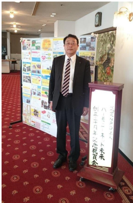
2/25 ハーモニー未来創立30周年