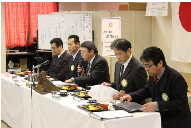
2月第3例会 山名会長挨拶