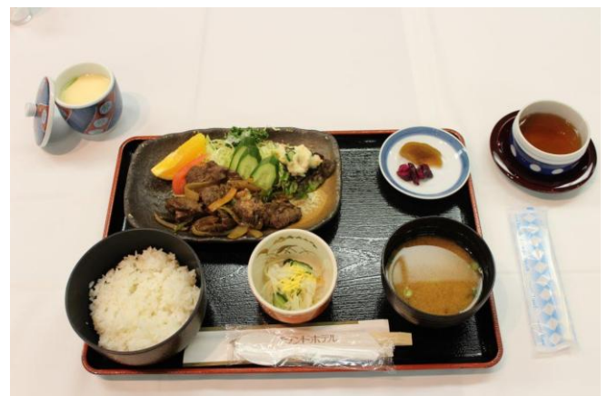
本日の食事 焼き肉定食