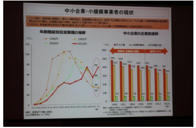
卓話「中小企業の持続的発展」