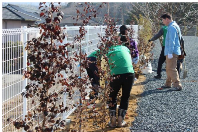
3/4 アースデイ記念植樹