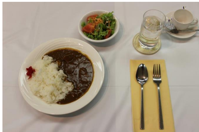
本日の食事 カレー（米山ランチ）