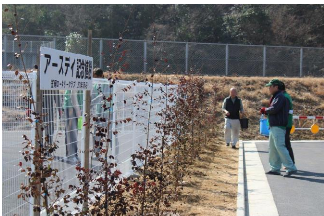
3/4 アースデイ記念植樹