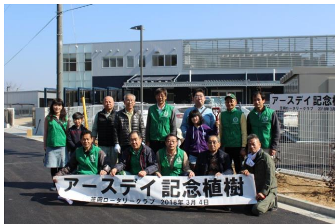
3/4 アースデイ記念植樹