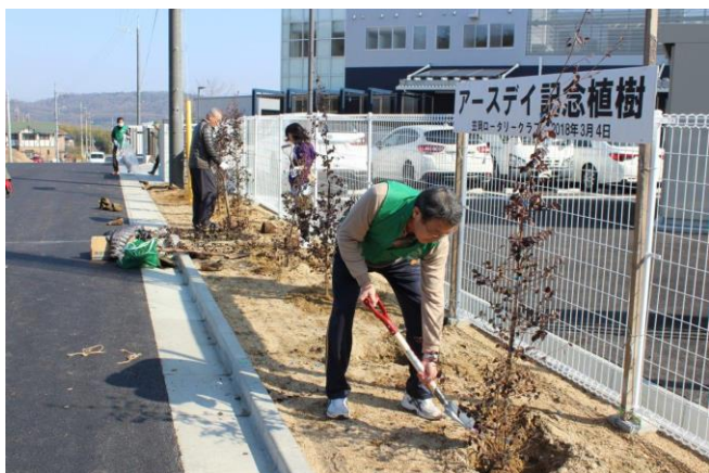
3/4 アースデイ記念植樹