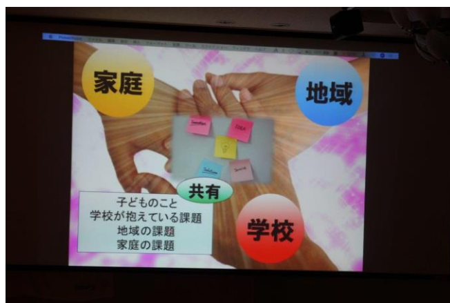
卓話「地域・家族との連携共同による落ち着いた学習環境の確保」