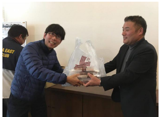
2/25 4クラブゴルフ大会 団体準優勝