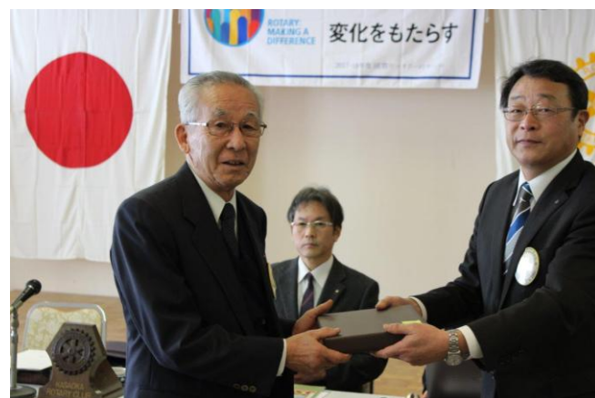
誕生記念月のお祝