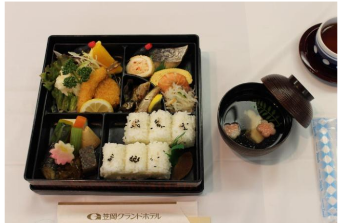
本日の食事 幕の内弁当