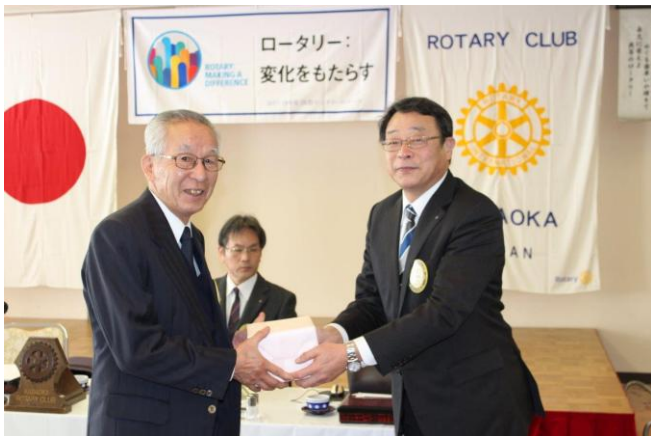
結婚記念月のお祝