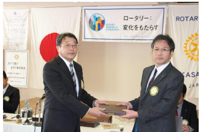
誕生記念月のお祝