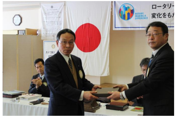
誕生記念月のお祝