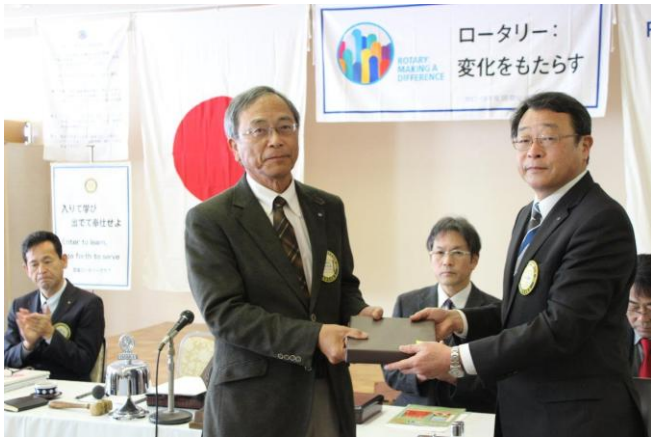
誕生記念月のお祝