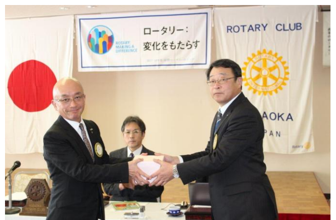
結婚記念月のお祝