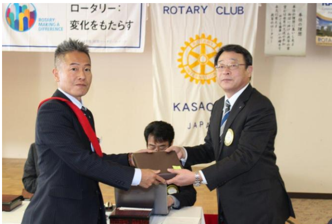
誕生記念月のお祝