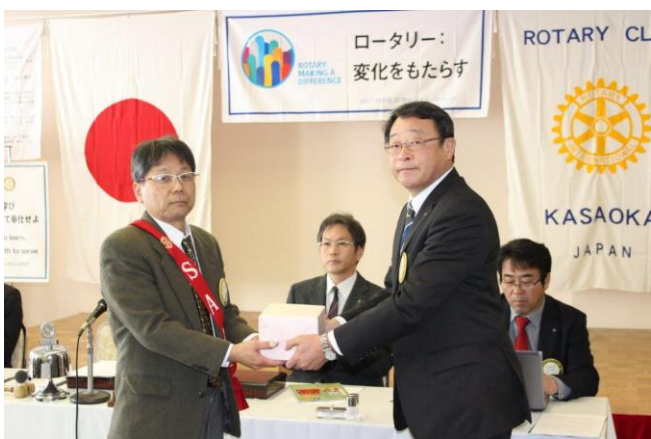
結婚記念月のお祝