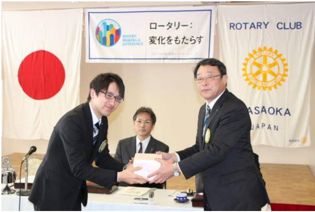
結婚記念月のお祝