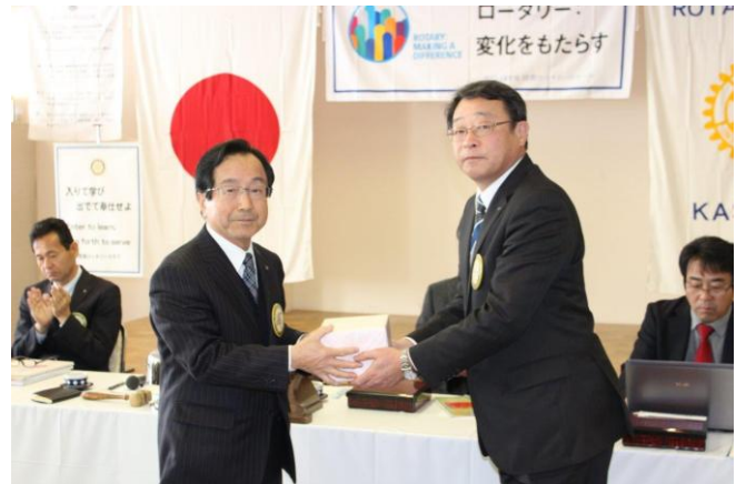
結婚記念月のお祝