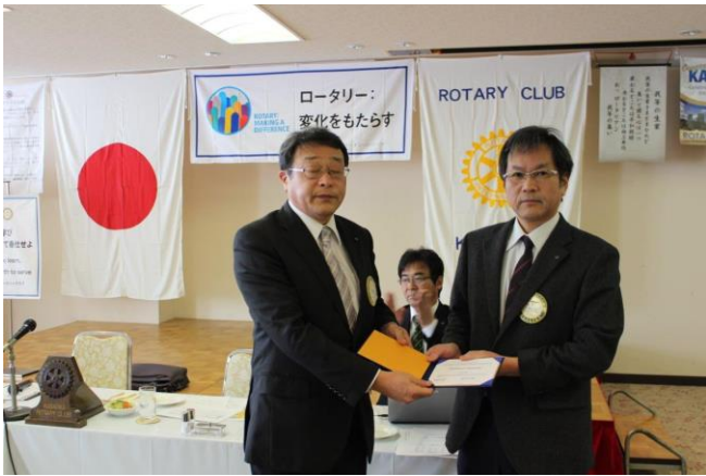
山名会長 ベネファクターの認証状