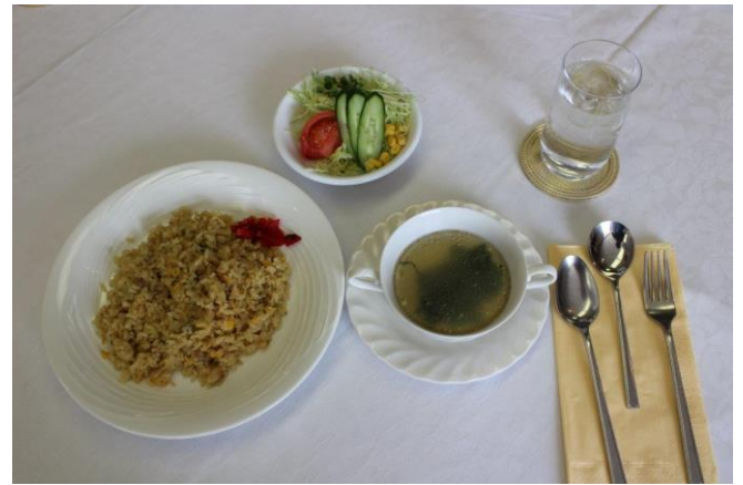
本日の食事 ピラフ (100万ドルランチ)