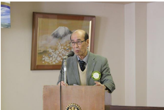
国定ガバナー補佐「IM 全体説明」