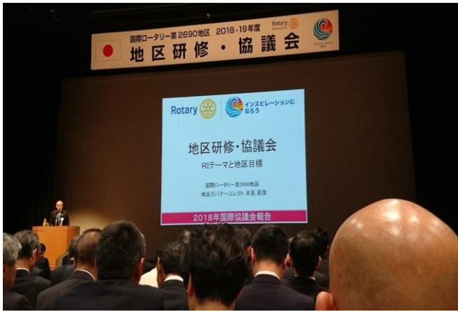
4/15 地区研修・協議会