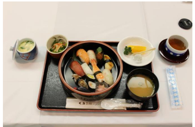
本日の食事 にぎり寿司定食