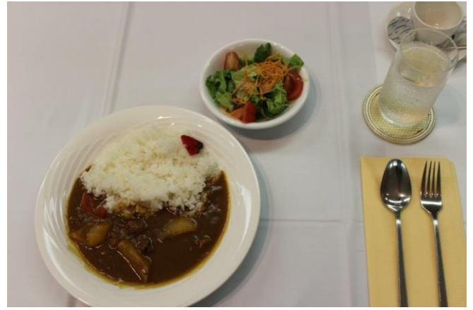
本日の食事 ビーフカレー (100万ドルランチ)