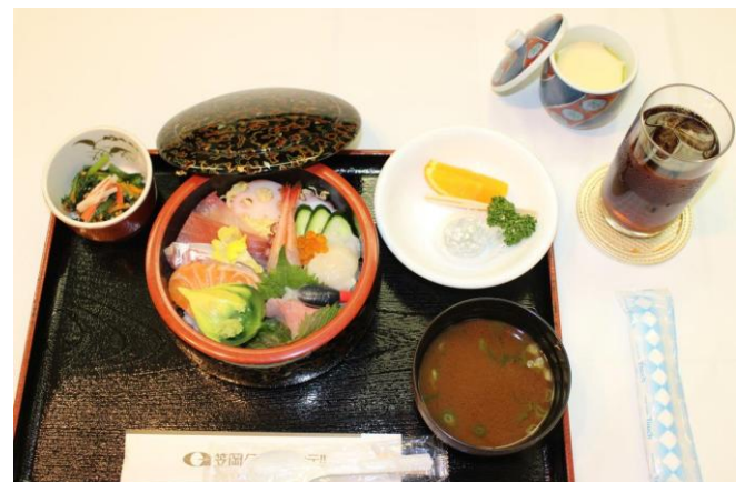
本日の食事 海鮮丼定食