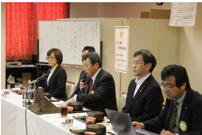
5月第3例会 山名会長挨拶