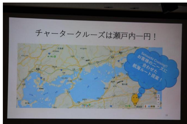
卓話「瀬戸内クルージングについて」