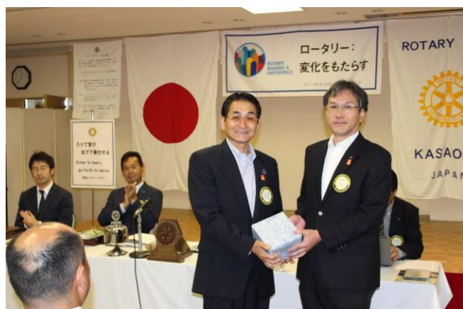
誕生記念月のお祝