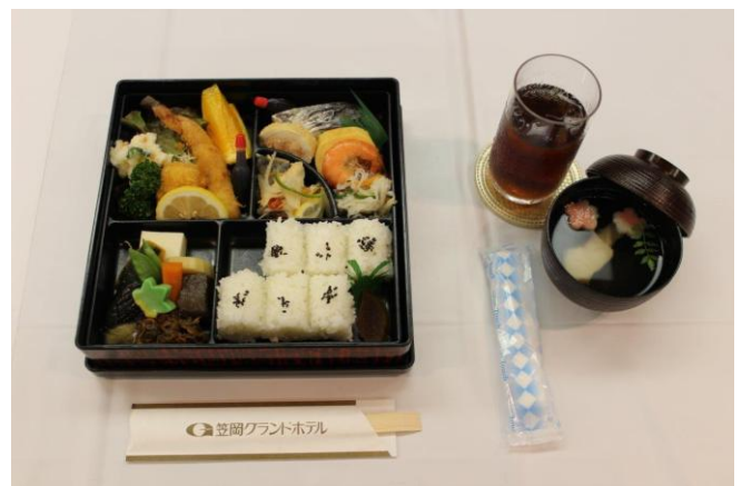
本日の食事 幕の内弁当