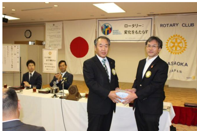
誕生記念月のお祝