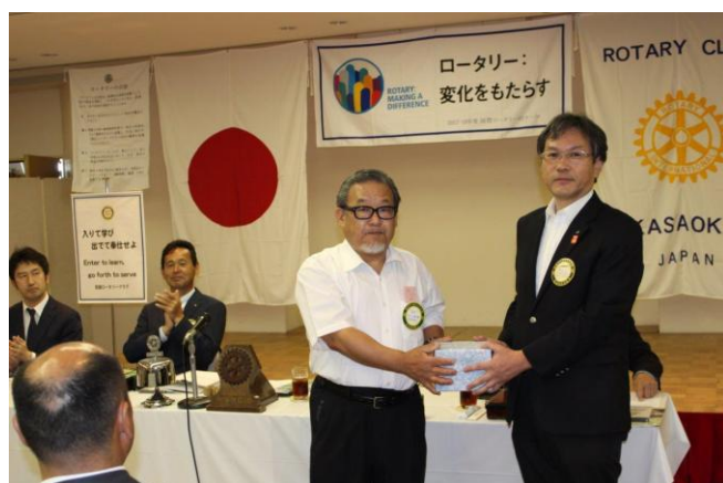
誕生記念月のお祝