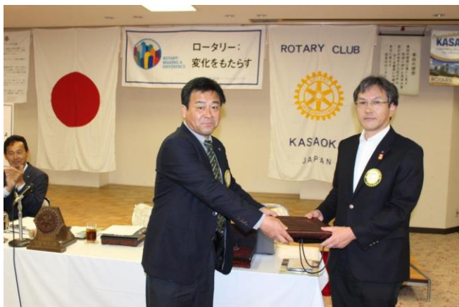
結婚記念月のお祝