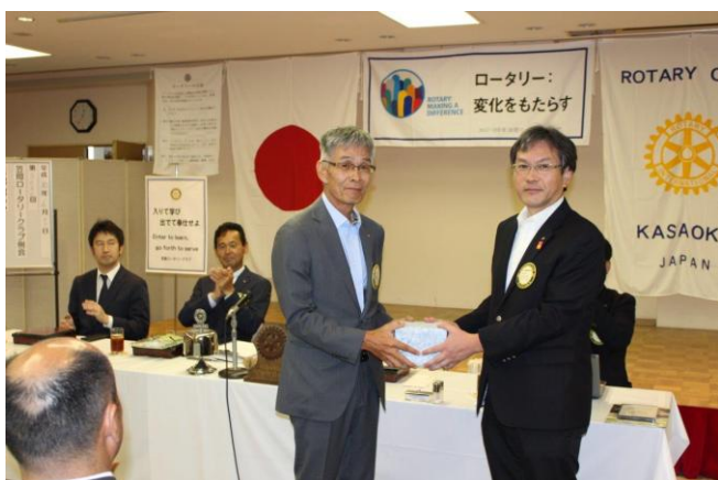
誕生記念月のお祝