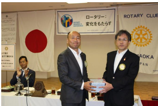
誕生記念月のお祝