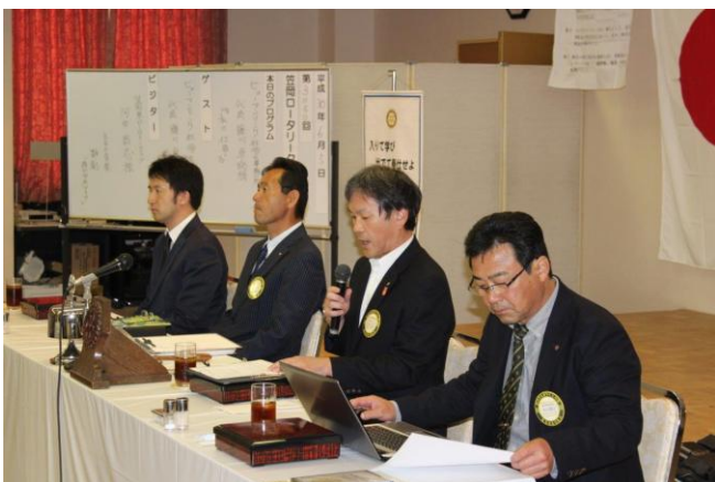
吉本副会長 会長代理で例会スタート