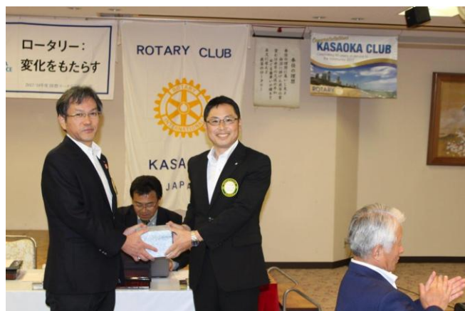
誕生記念月のお祝