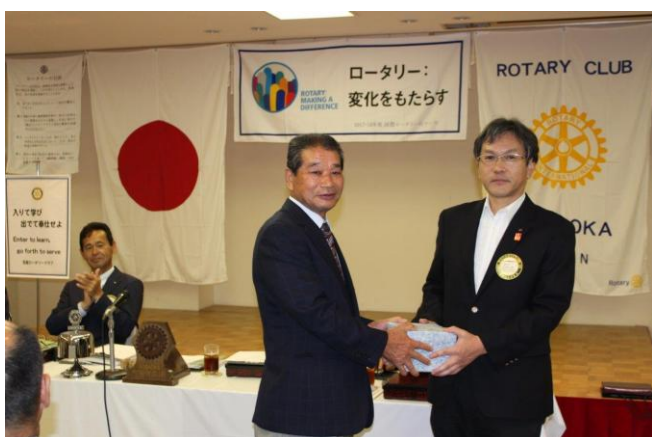
誕生記念月のお祝