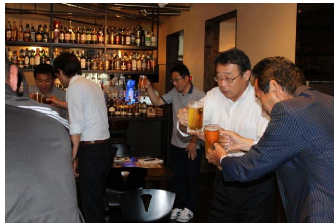
6/12 しょちゅう飲もう会 (新会員歓迎会)