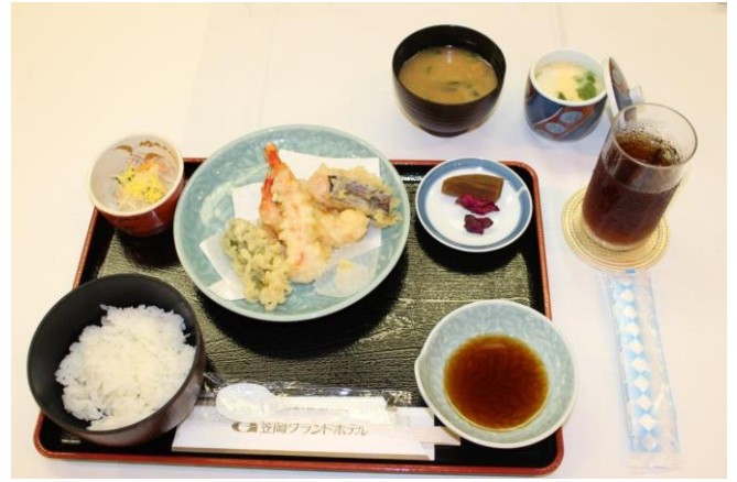
本日の食事 天ぷら定食