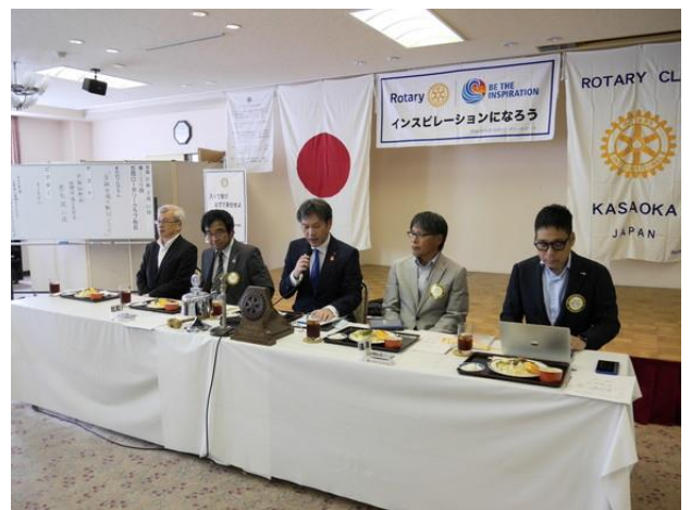
8月第2例会 吉本会長挨拶