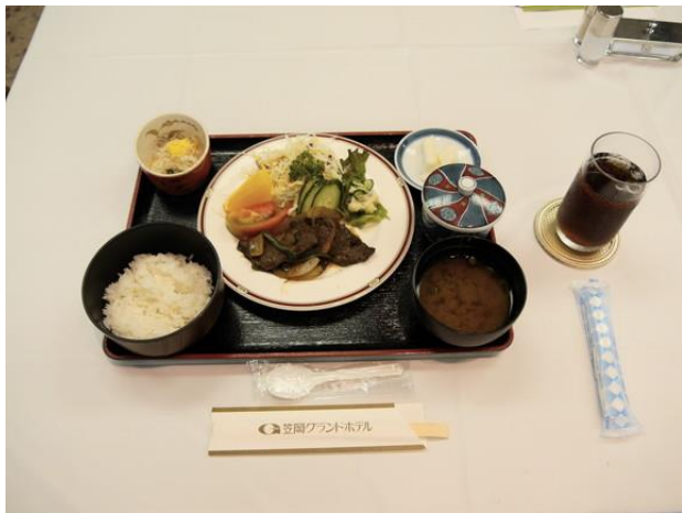
【本日の食事】牛焼肉定食