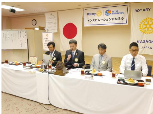
10月第2例会 吉本会長挨拶