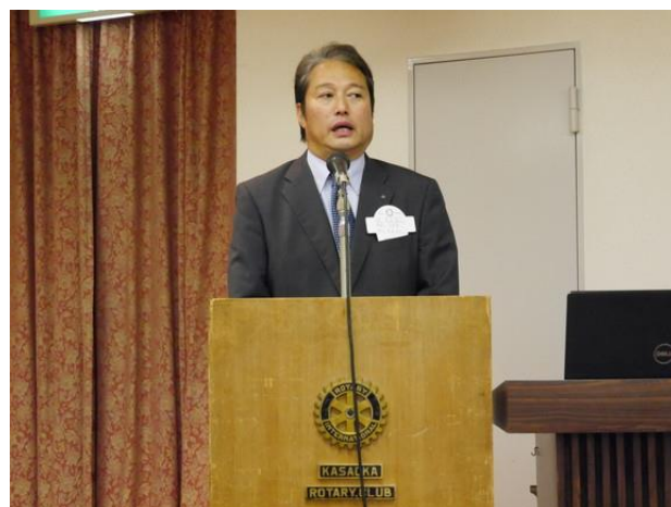
井原RC片山様挨拶（地区大会親睦会出席依頼）