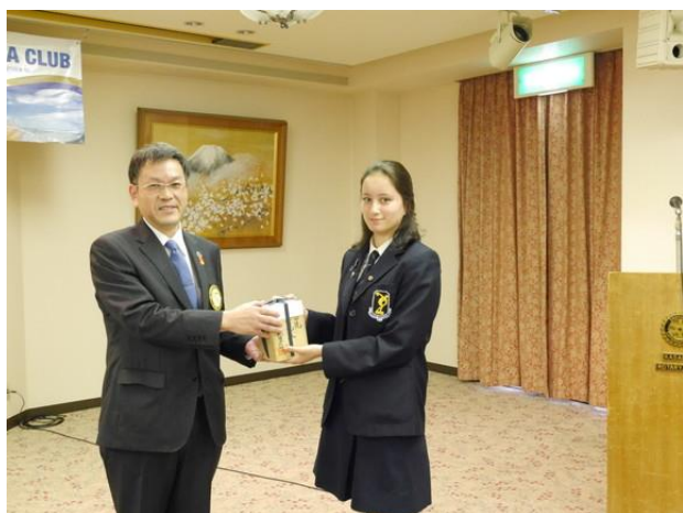
タウランガRCへプレゼント贈呈