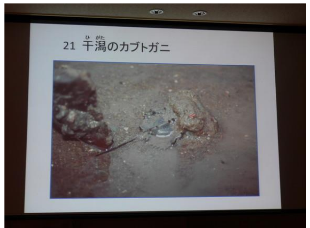
カブトガニ博物館館長 惣路紀通様 卓話