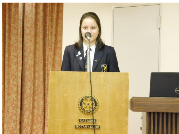
サマンサさんから帰国にあたっての挨拶