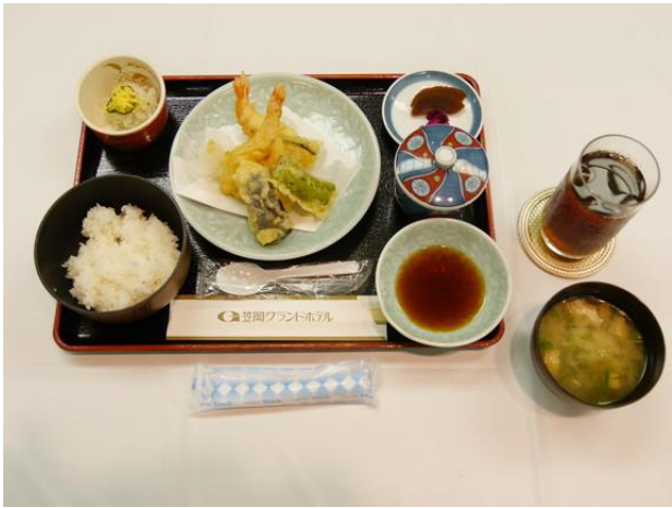
【本日の食事】天ぷら定食