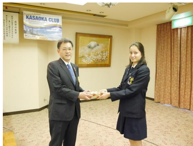
タウランガRCよりプレゼント受領