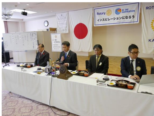
11月第3例会 吉本会長挨拶