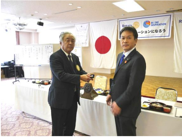
廣井会員 ポールハリスフェローバッチ贈呈