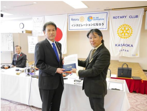
吉本会長 ベネファクター認証状ピンバッチ贈呈