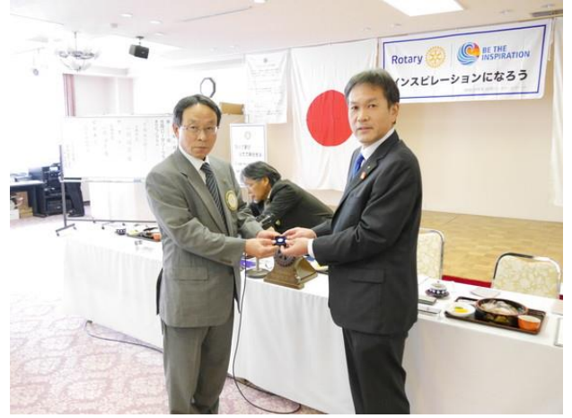
西井会員 ポールハリスフェローバッチ贈呈