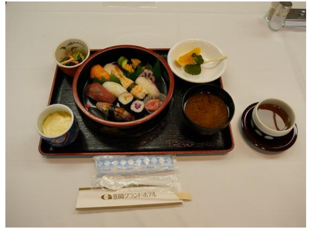
【本日の食事】にぎり寿司定食