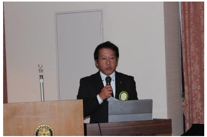
笠原孝方会員卓話