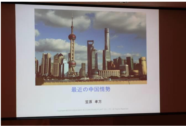
笠原孝方会員卓話