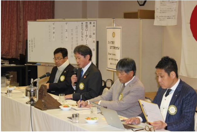
12月第2例会 吉本会長挨拶