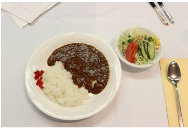
【本日の食事】ハヤシライス（米山ランチ）