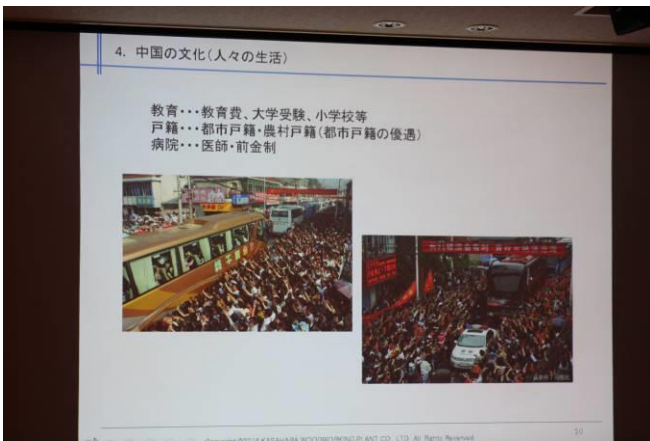
笠原孝方会員卓話