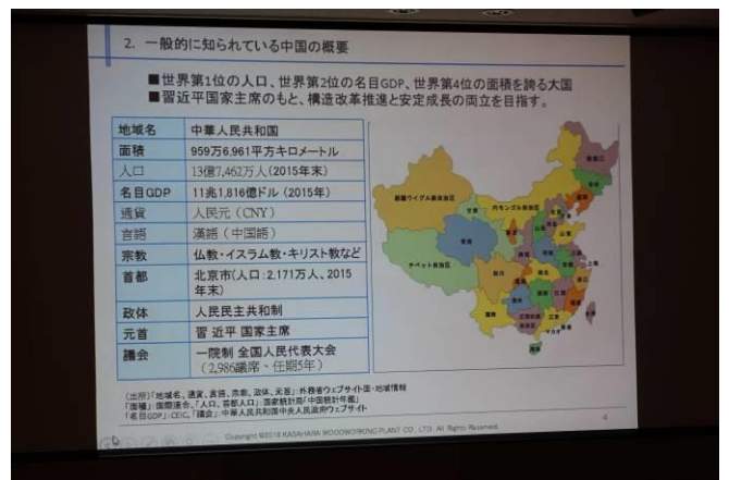
笠原孝方会員卓話