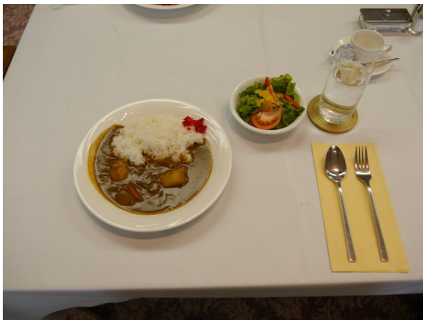
【本日の食事】ビーフカレー (100万ドルランチ)