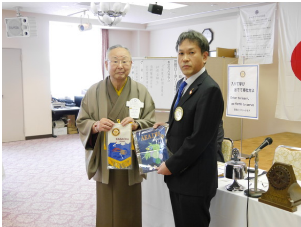
赤磐RC雷門様とバナー交換