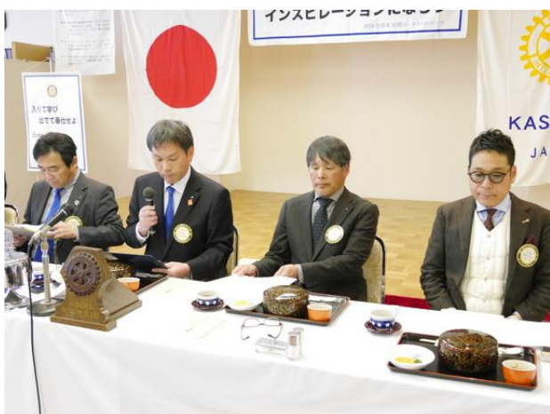
1月第4例会 吉本会長挨拶