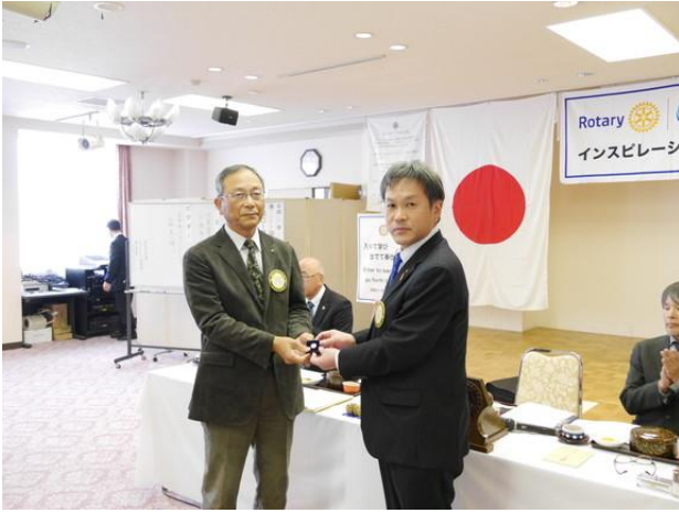
武田会員 ポールハリスフェロー認証バッジ贈呈