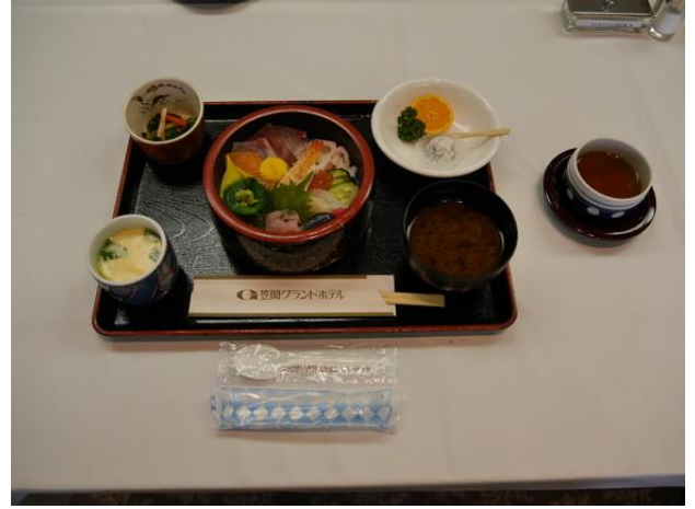
【本日の食事】海鮮ちらし寿司定食