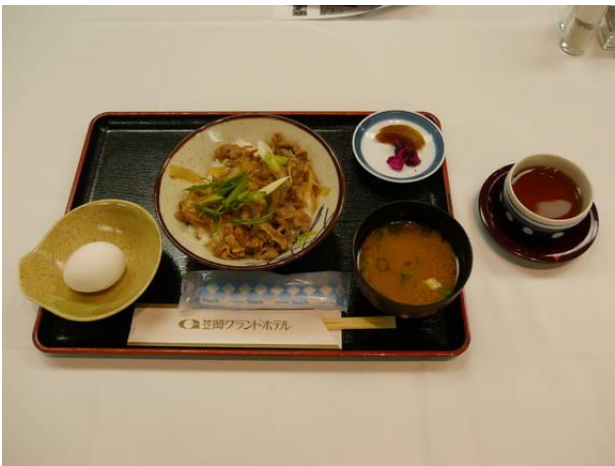
【本日の食事】牛丼（米山ランチ）