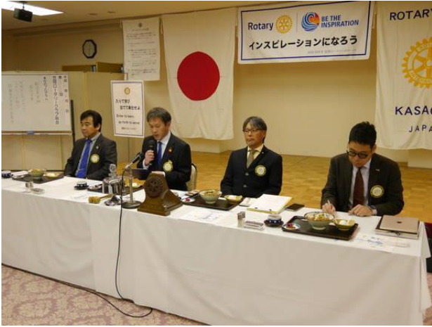
2月第2例会 吉本会長挨拶