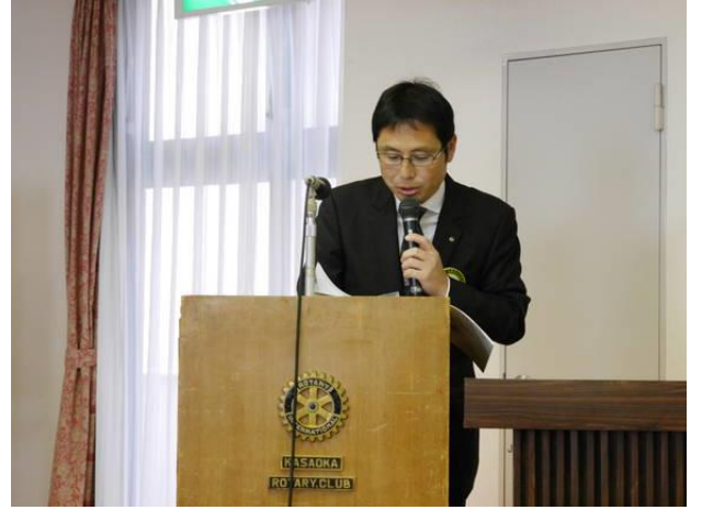
久我会員「地区研修・協議会報告」