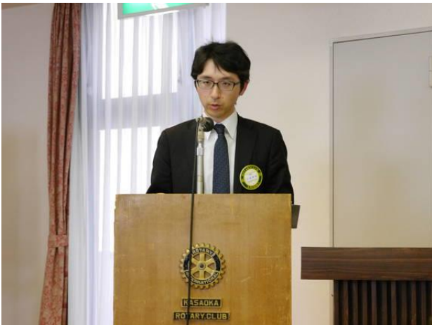
片岡会員「地区研修・協議会報告」