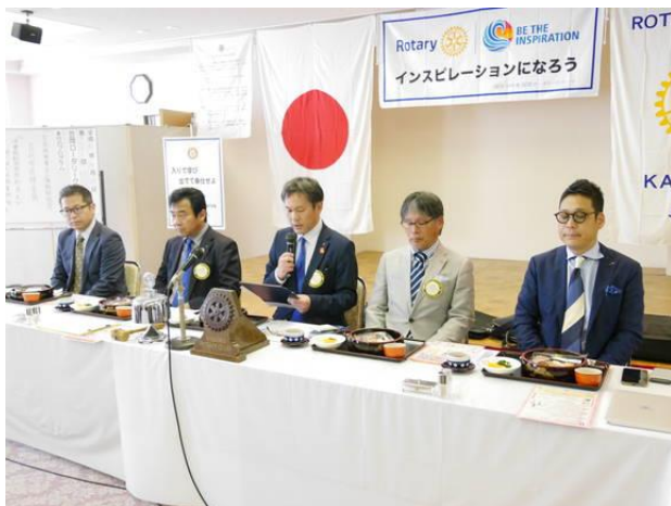
4月第4例会 吉本会長挨拶