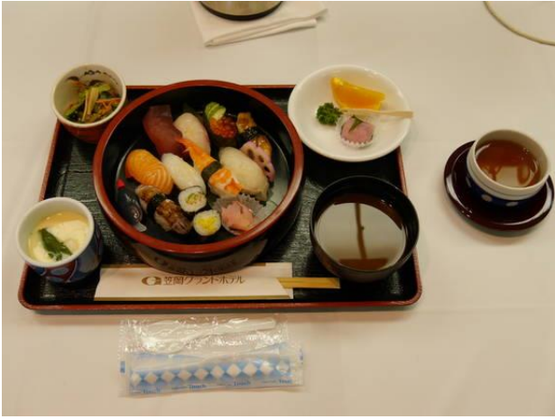
【本日の食事】にぎり寿司定食