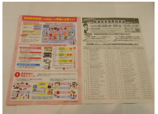
笠岡税務署法人課税部門 統括官 吉村昭信様卓話