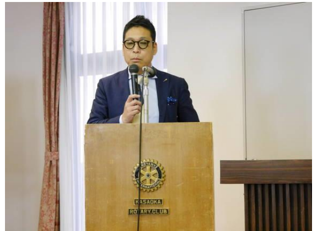
藤井副幹事「地区研修・協議会報告」