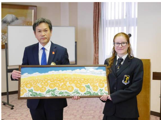
タウランガRCへお土産贈呈