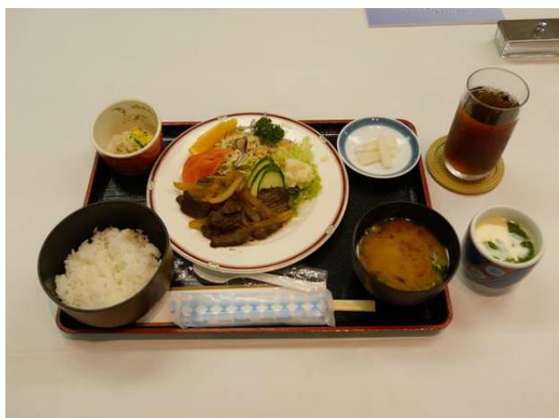
【本日の食事】焼き肉定食