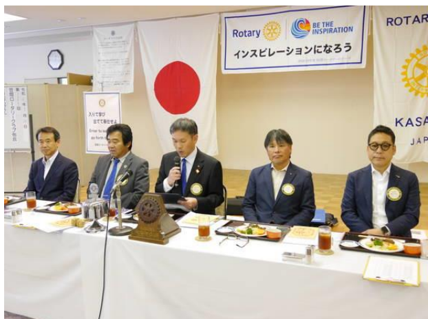
5月第4例会 吉本会長挨拶