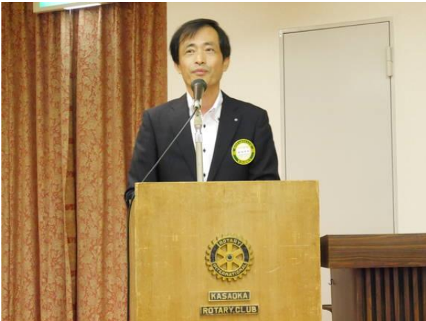
各委員会委員長卓話「一年を振り返って」