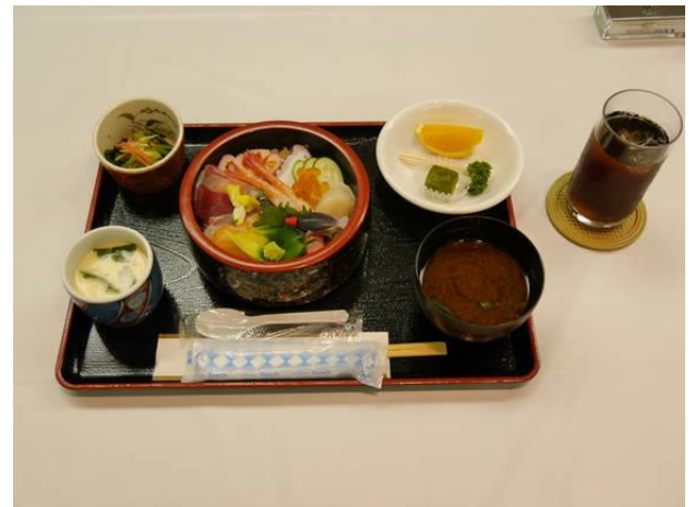
【本日の食事】海鮮丼定食