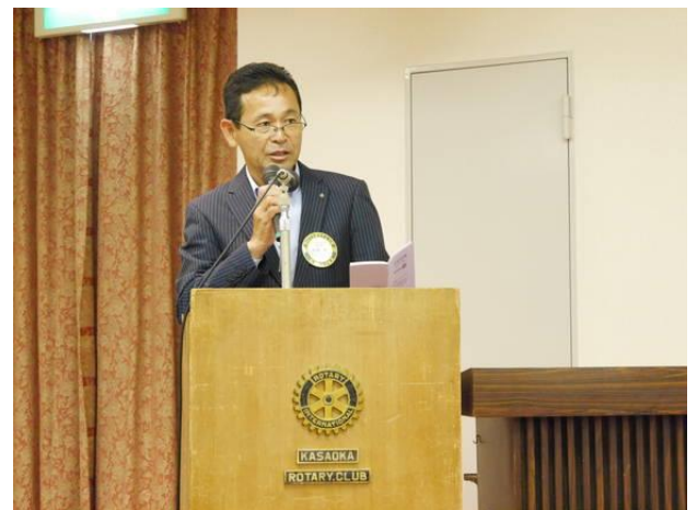
各委員会委員長卓話「一年を振り返って」