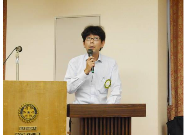
各委員会委員長卓話「一年を振り返って」