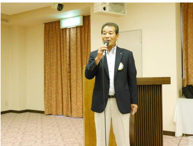
各委員会委員長卓話「一年を振り返って」