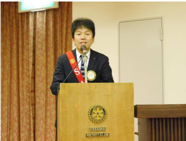
各委員会委員長卓話「一年を振り返って」