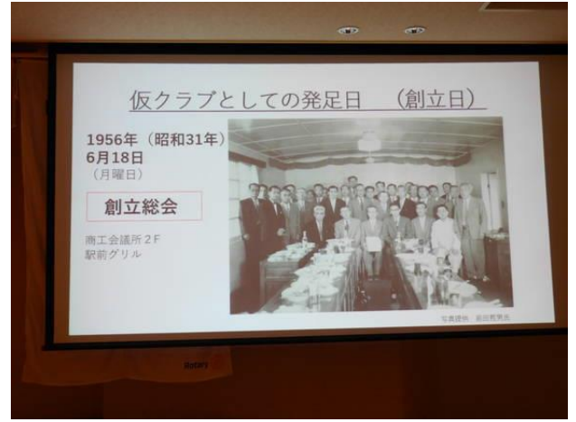
6月第3例会 吉本会長挨拶