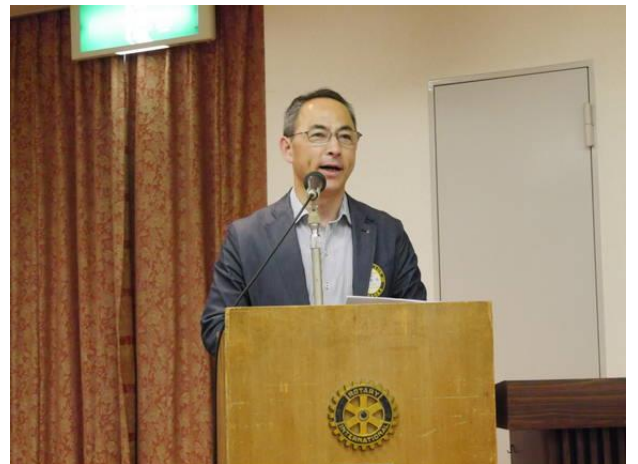
各委員会委員長卓話「一年を振り返って」