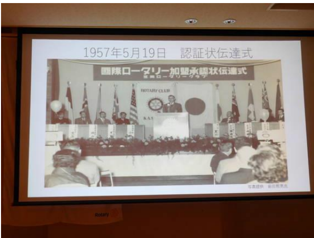
6月第3例会 吉本会長挨拶