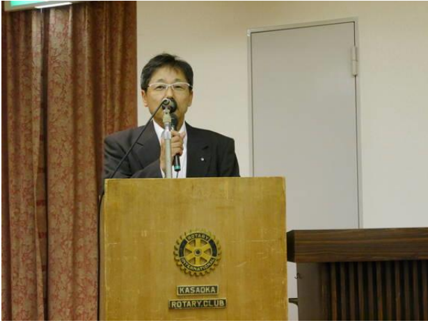
各委員会委員長卓話「一年を振り返って」