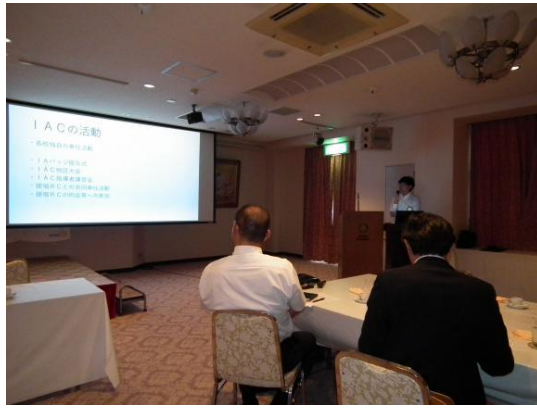
インターアクト地区大会報告