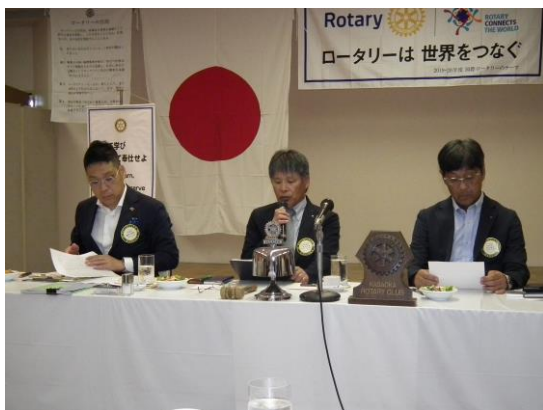
7月第4回例会会長挨拶