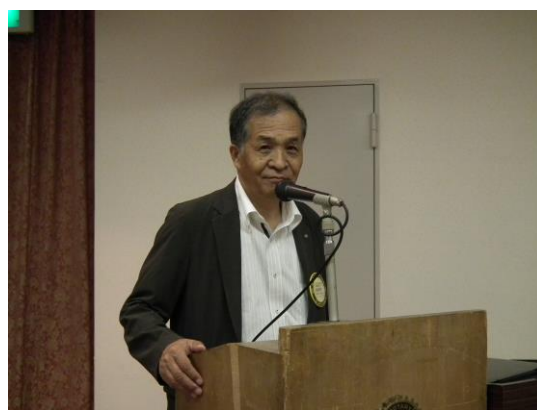
塩飽直前会計より決算報告書