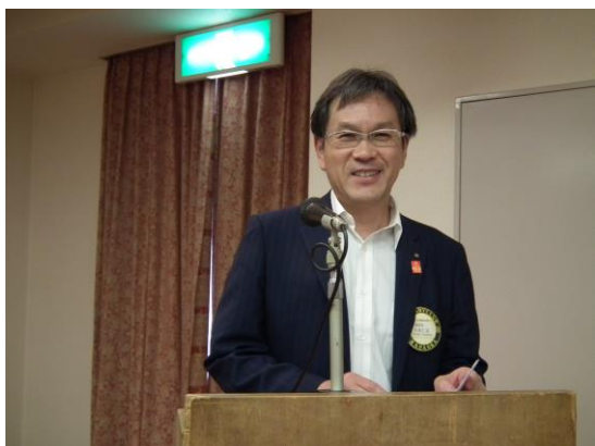
吉本直前会長前年度最終理事会報告