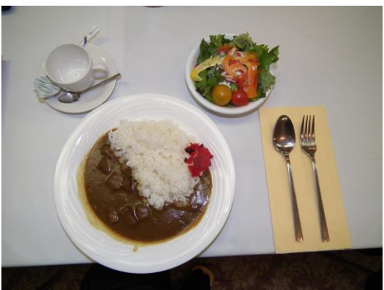
本日の食事カレー(100万ドルランチ)