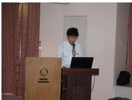
中田委員長よりインターアクト地区大会報告