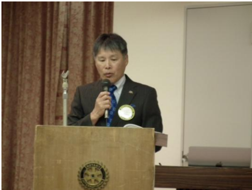
会長【クラブ運営方針】発表