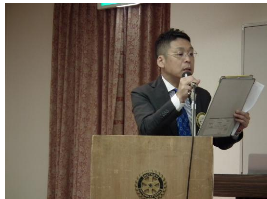
藤井幹事初幹事報告