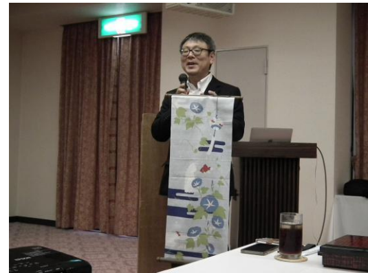
結婚記念品の紹介