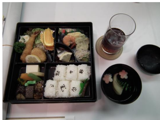
【本日の食事】 幕の内弁当