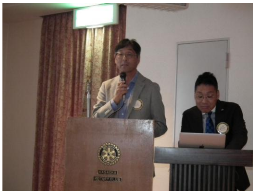
奉仕プロジェクト委員会