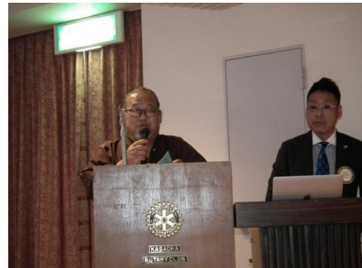
公共イメージ常任委員会