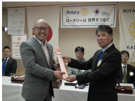
結婚記念月のお祝い