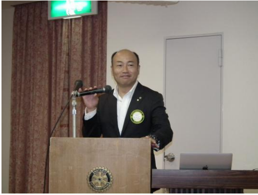
坂本出席委員長初登板