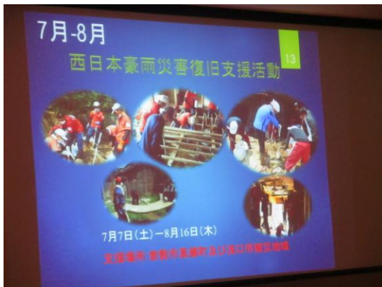
『インターアクトクラブの活動』報告