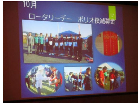
『インターアクトクラブの活動』報告