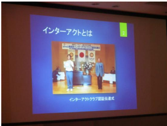
『インターアクトクラブの活動』報告