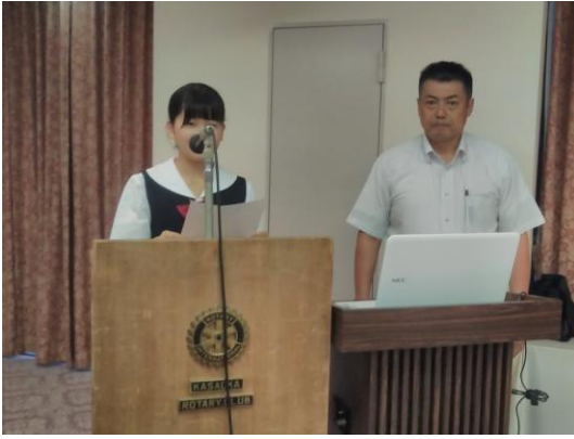
卓話『インターアクトクラブの活動』報告