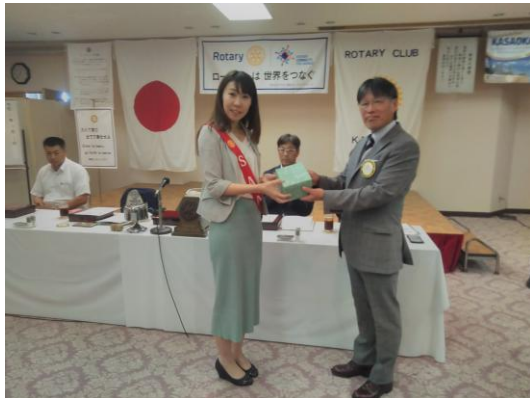
桑田会員御誕生日御祝