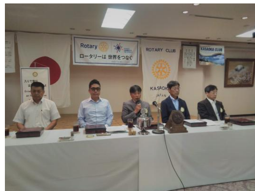
9月第一例会会長挨拶