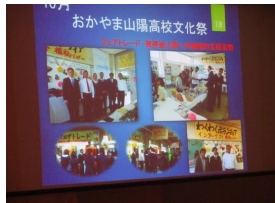
『インターアクトクラブの活動』報告