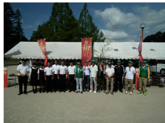
『インターアクトクラブの活動』報告