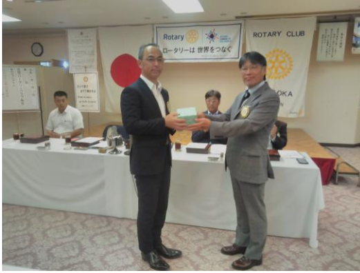
堀会員誕生日御祝