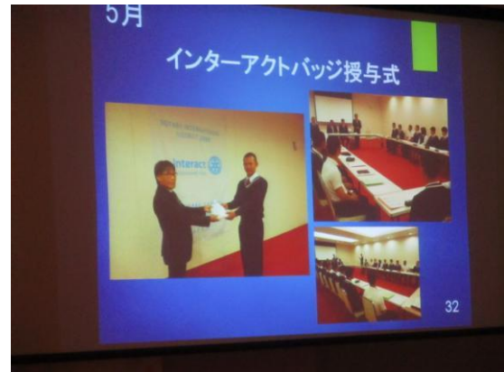
『インターアクトクラブの活動』報告