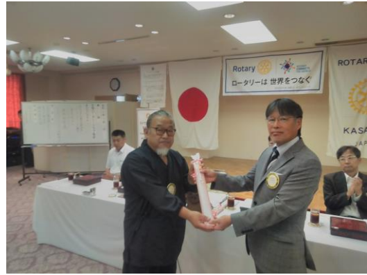
水川会員結婚記念日御祝