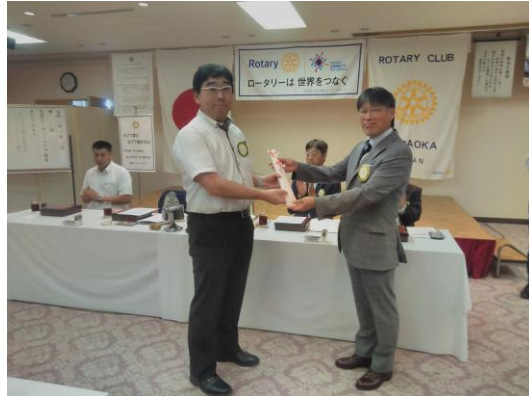
楠会員結婚記念日御祝