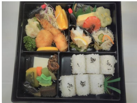
本日のプログラム幕の内弁当