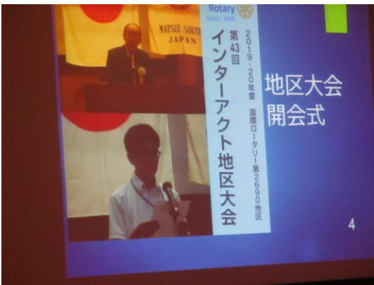
『インターアクトクラブの活動』報告