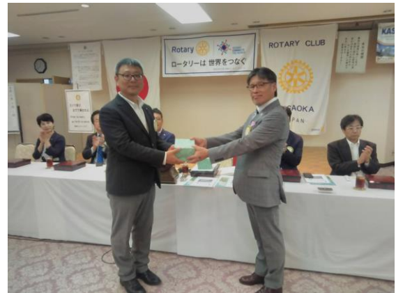
青山会員誕生日御祝