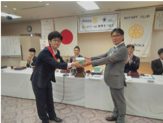
横山会員誕生日御祝