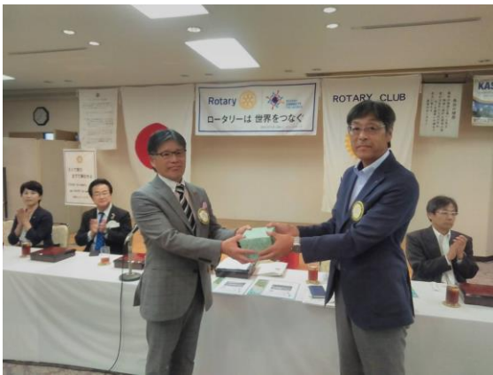
小笠原会長誕生日御祝