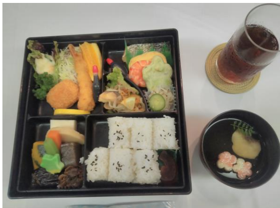
本日の食事(幕の内弁当)