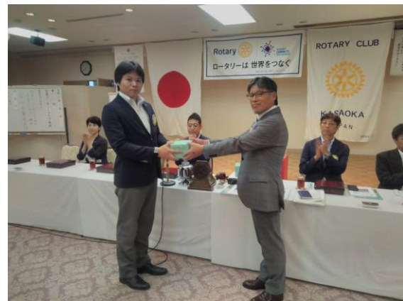
枝木会員誕生日御祝