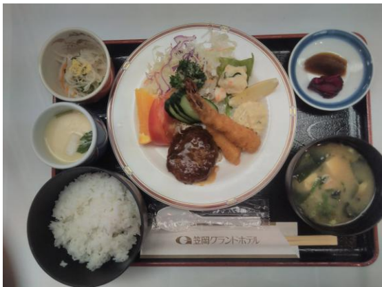
本日の食事(ハンバーグとエビフライ定食)