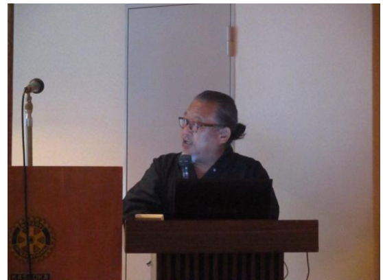
地区雑誌・広報委員長会議報告