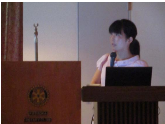
第13回笠岡RC杯サッカー大会報告