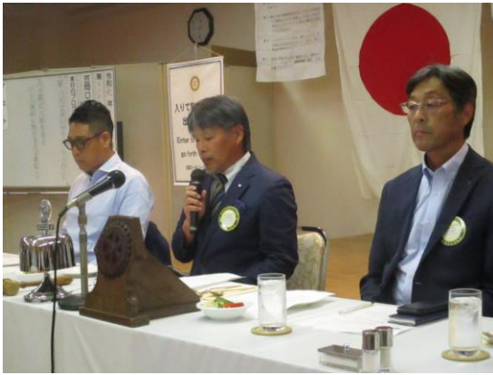
8月第2例会会長挨拶