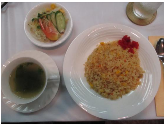
本日の食事ピラフ(米山ランチ)