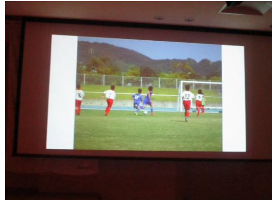
第13回笠岡RC杯サッカー大会報告