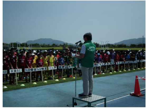
第13回笠岡RC杯サッカー大会報告