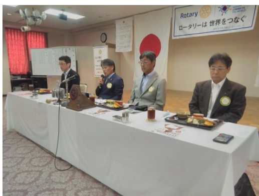
9月第1例会会長挨拶