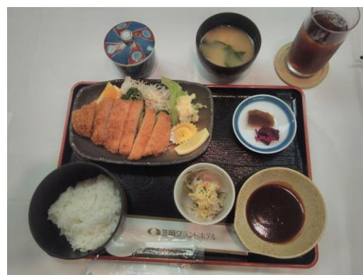
本日の食事 豚カツ定食