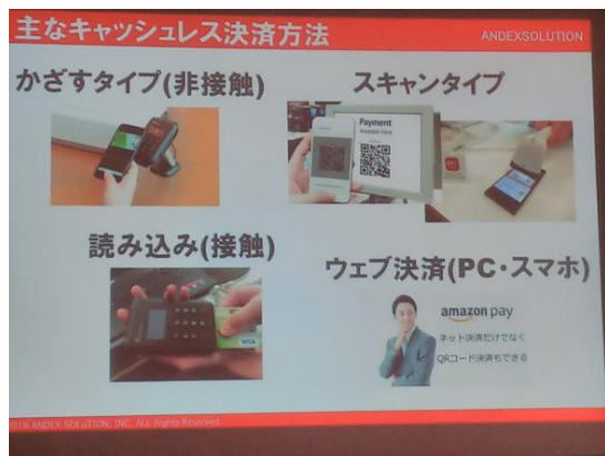
本日の卓話キャッシュレス事情と最新動向