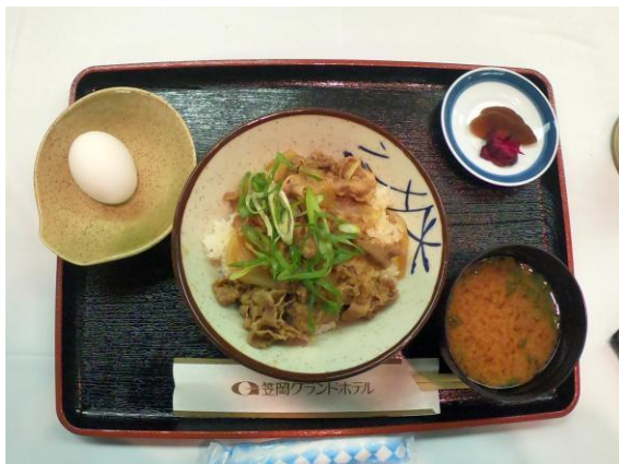
本日の食事牛丼(100万ドルランチ)