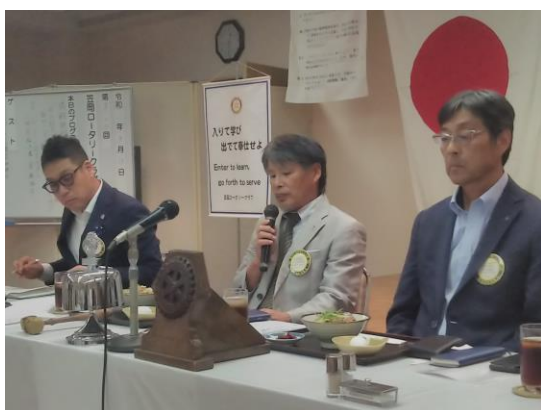
9月第4回例会会長挨拶