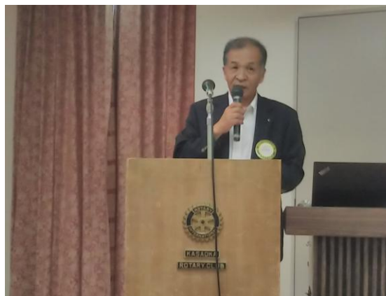
塩飽財団・奨学会常任委員長卓話