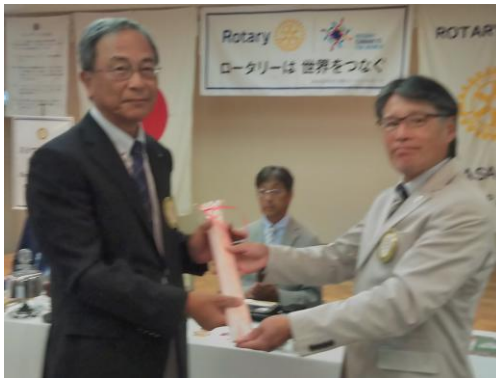
武田会員結婚記念日御祝