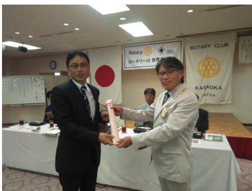
久我会員結婚記念日御祝