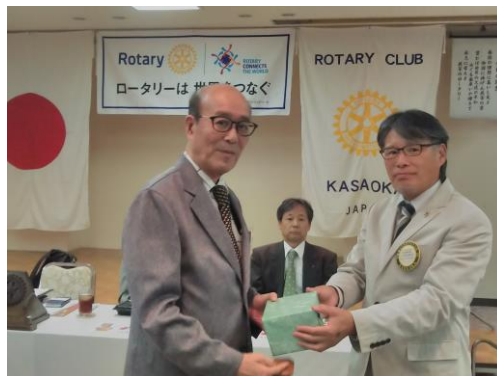
国定会員誕生日御祝