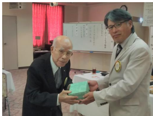
仁科会員誕生日御祝