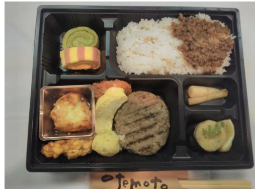
本日の食事 「ジビエ料理」