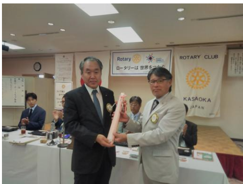
長舗会員結婚記念日御祝