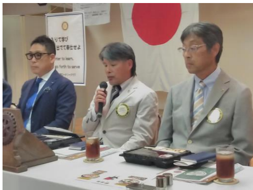
10月第1例会会長挨拶