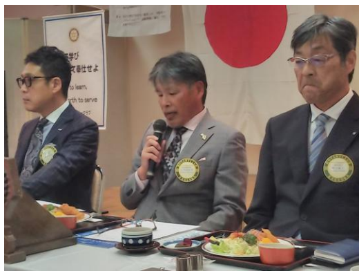
11月第3例会会長挨拶