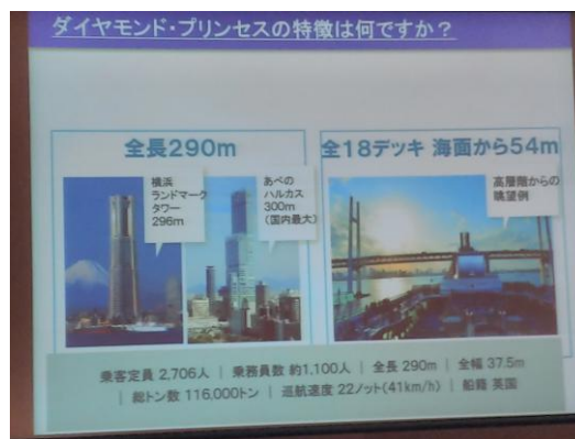
本日の卓話『ダイヤモンド・プリンセス』