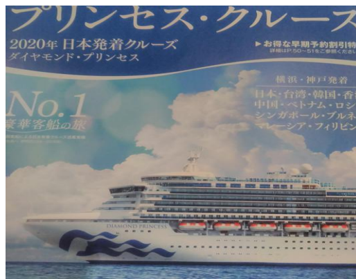
本日の卓話『ダイヤモンド・プリンセス』