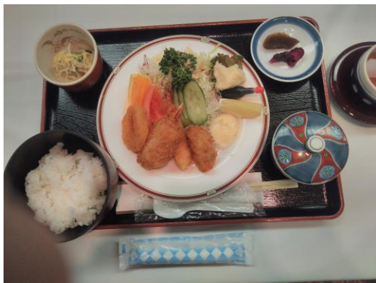
本日の食事 ミックスフライ定食