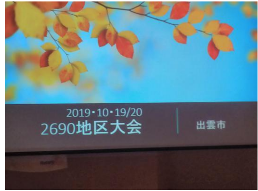
本日の卓話 地区大会報告