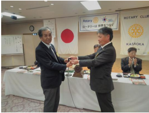
塩飽会員ポールハリスフェローバッチ贈呈