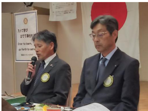
10月第4回例会会長挨拶