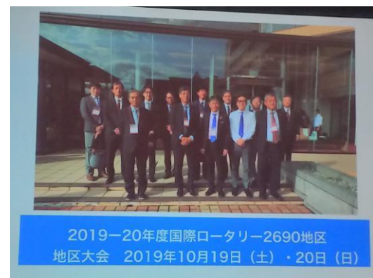
本日の卓話 地区大会報告