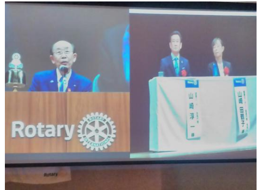
本日の卓話 地区大会報告