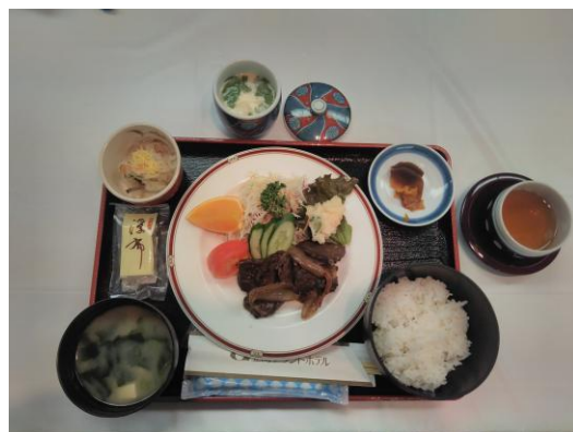
本日の食事 牛焼肉定食