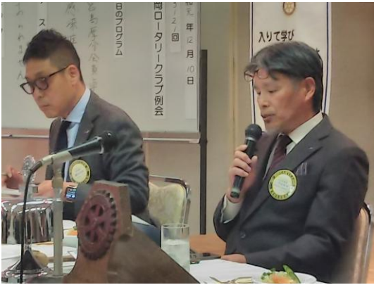
12月第2例会会長挨拶