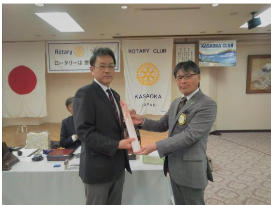
結婚記念月の御祝