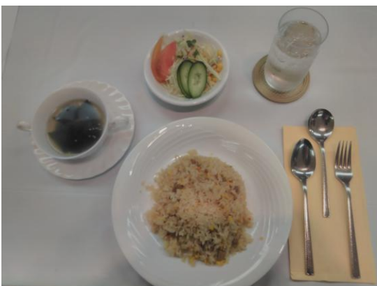
本日の食事 ピラフ(米山ランチ)