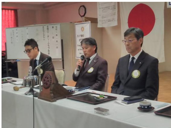
12月第4例会会長挨拶