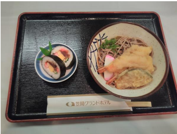
本日の食事 年越しそばと巻き寿司