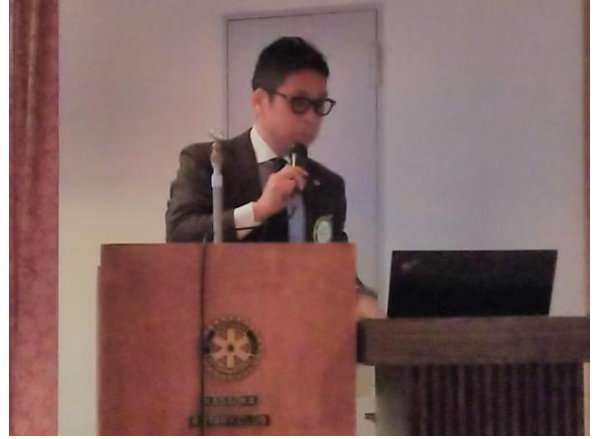
藤井幹事アンケート結果発表