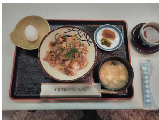
本日の食事 牛丼定食