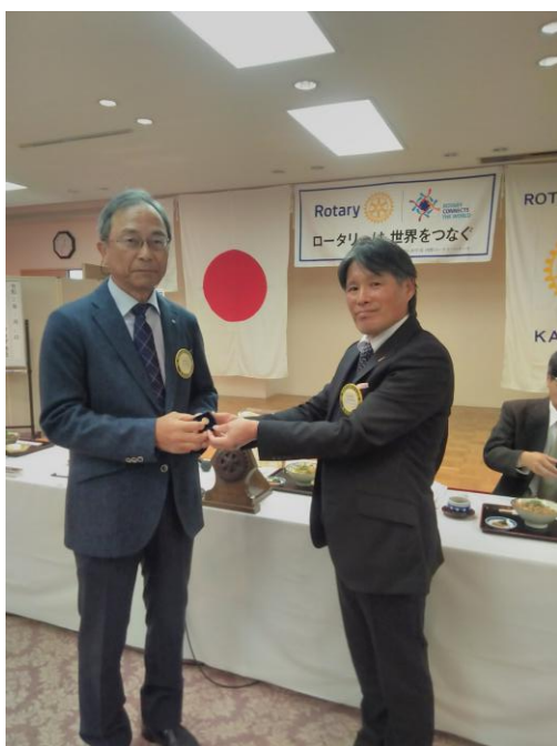
武田会員ポールハリスフェロー贈呈