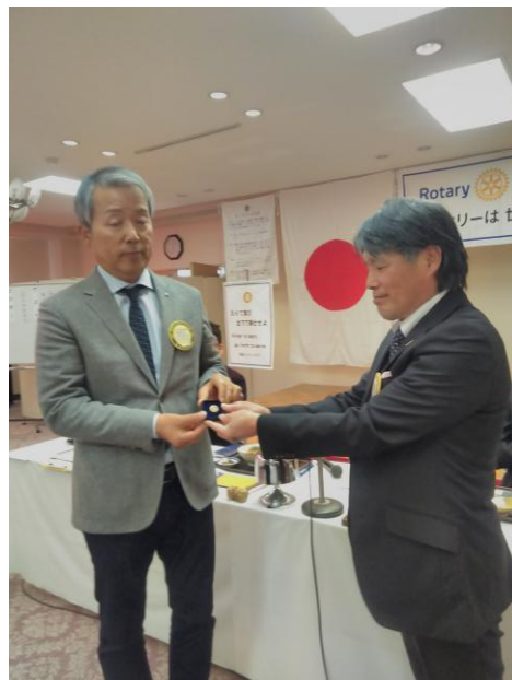
西江会員ポールハリスフェロー贈呈