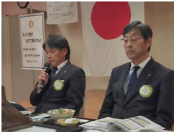
1月第三例会会長挨拶