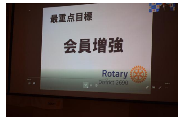
西山副会長「次年度活動方針」