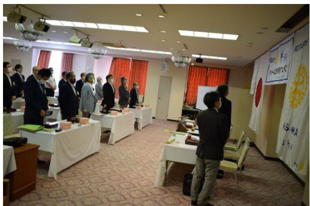
コロナ対策 スクール形式座席