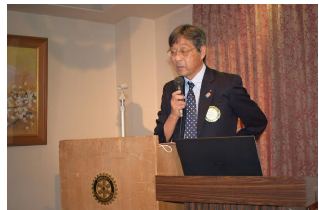
西山副会長「次年度活動方針」