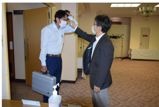
コロナ対策 検温・アルコール消毒