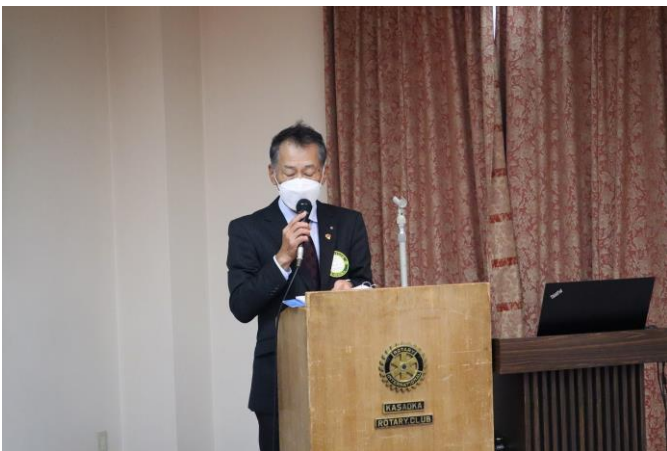
念願の100%例会達成報告！