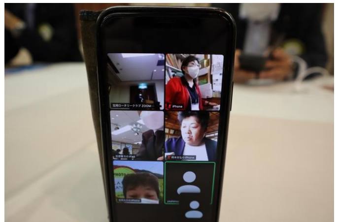
ZOOMでの参加状況(右側2名)