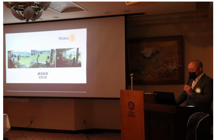
ゴルフ教室&親子ゴルフ大会報告で熱弁する団迫会員