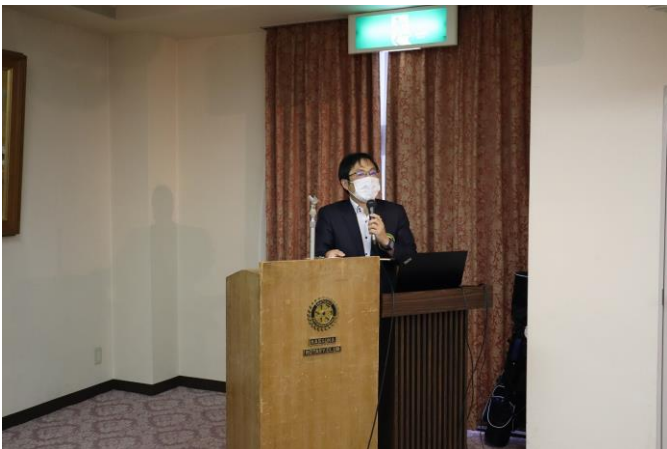
地区公共イメージセミナー報告 久我会員