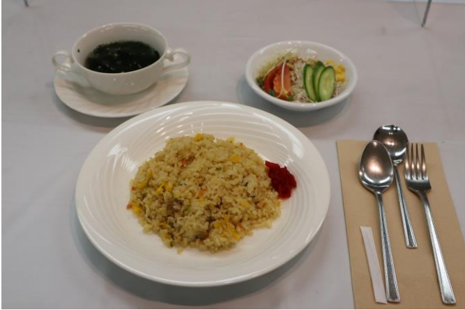
100万ドル ザ・チャーハン