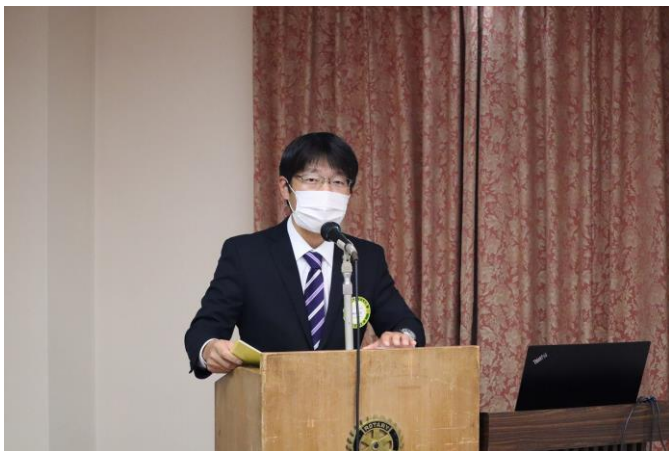
親睦旅行&クリスマス家族例会PR