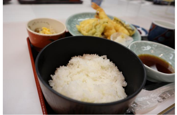
実りの秋 美味しいごはん