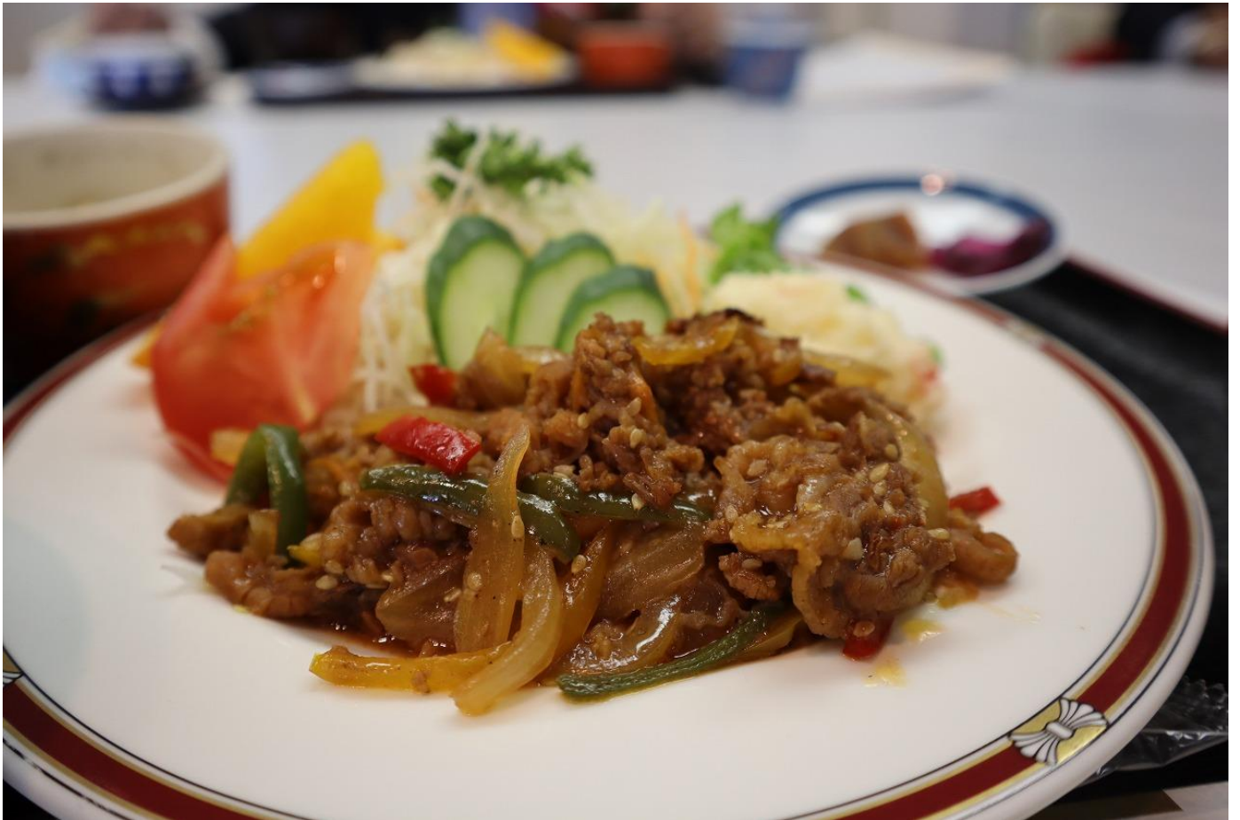
いつも美味しいご飯をありがとうございます！