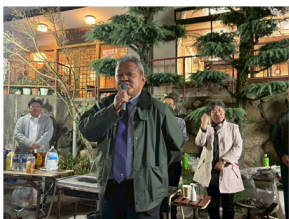
とても楽しい花見例会でした